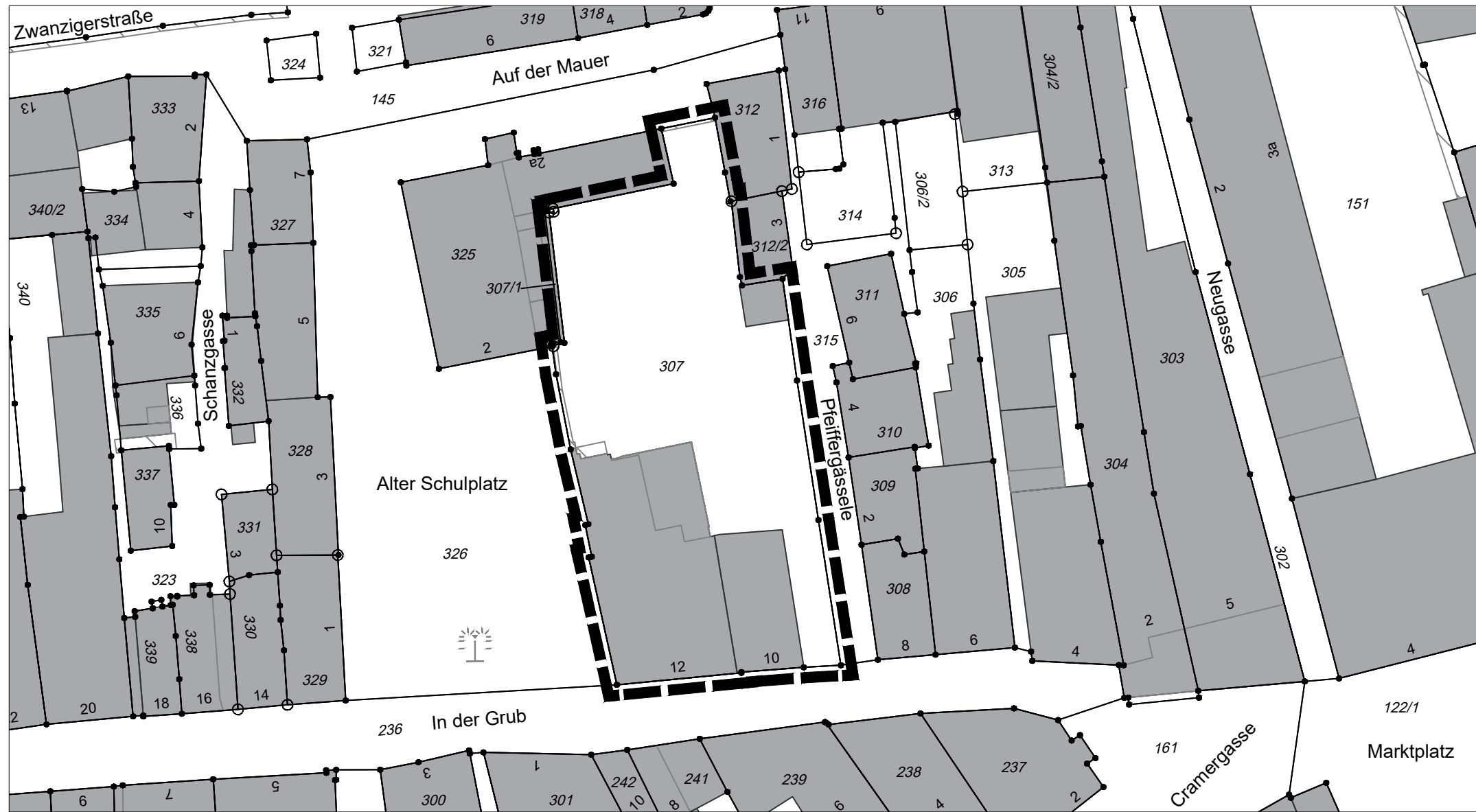
Bebauungsplan Nr. 86 "Altstadt", 12. Änderung "In der Grub 10 und 12", Lageplan zur Verlängerung der Veränderungssperre

Stadtbauamt Lindau 06.12.2022 Stadtplanung / Möller / fei